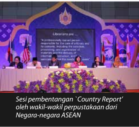
Sesi pembentangan 'Country Report' oleh wakil-wakil perpustakaan dari Negara-negara ASEAN