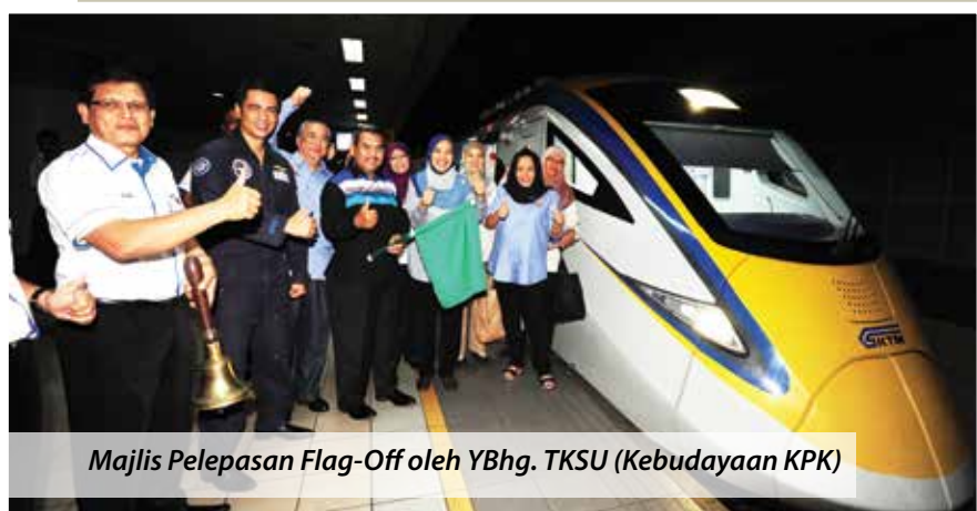
Majlis Pelepasan Flag-Off oleh YBhg. TKSU (Kebudayaan KPK)