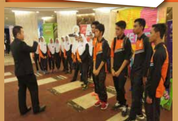
Lawatan sambil belajar oleh Sekolah Menengah Kebangsaan Putrajaya Presint 9(2)