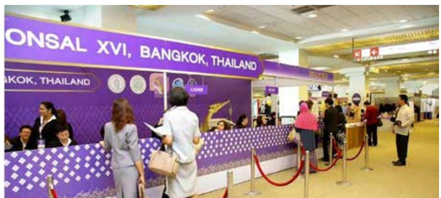
Kaunter pendaftaran peserta Persidangan CONSAL XVI dibuka pada 10 Jun 2015 di ruang legar, BITEC, Bangkok.

Hari kedua Persidangan CONSAL XVI merupakan hari pembentangan kertas