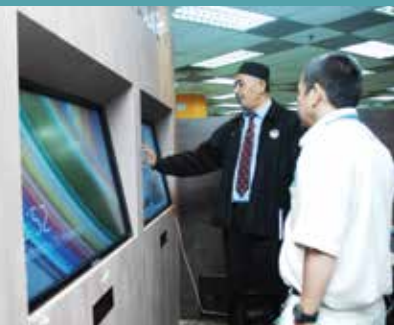
Samsung Smart Library (SSL)