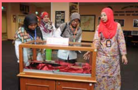
Pusat Rujukan Malaysiana (Koleksi Nadir)