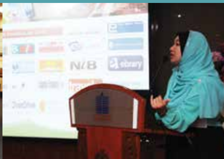
Taklimat PNM Digital