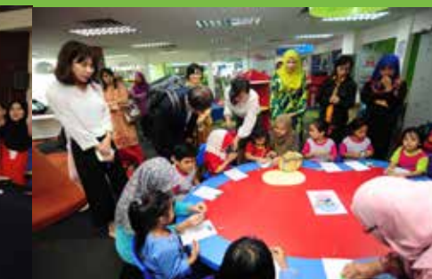
Perpustakaan Komuniti UTC Keramat Mall