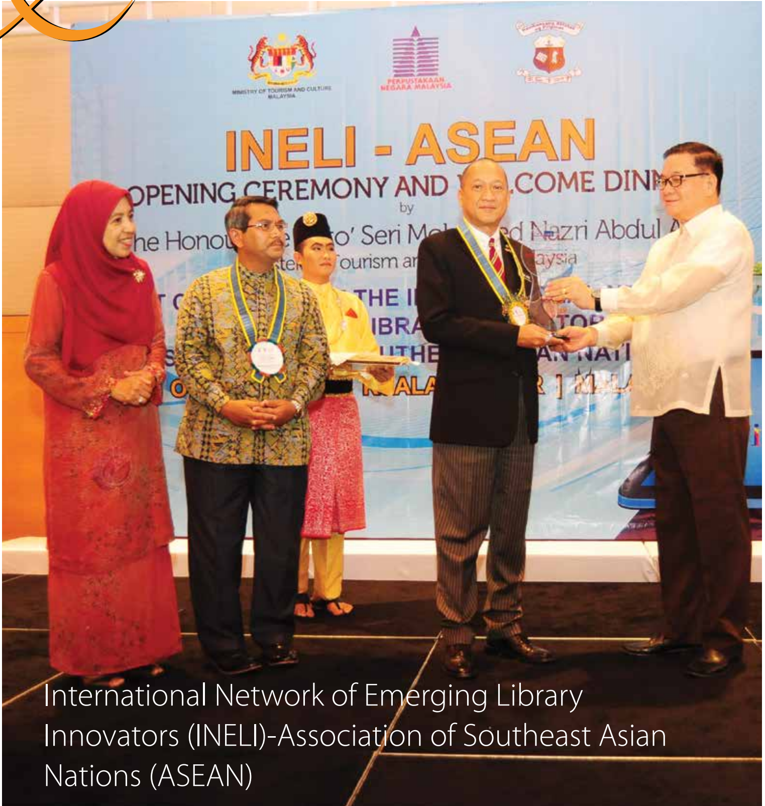
International Network of Emerging Library Innovators (INELI)-Association of Southeast Asian Nations (ASEAN)

BIL. 2/2015 ISSN: 0128-8679 KELUARAN JUL - DIS 2015