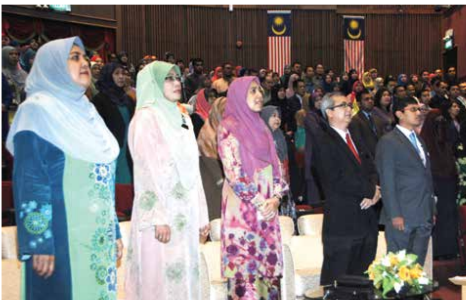
Pengurusan tertinggi PNM bersama-sama kakitangan semasa Perhimpunan Bulanan

Sekian, Wabillahittaufig wal hidayah wassalamualaikum.