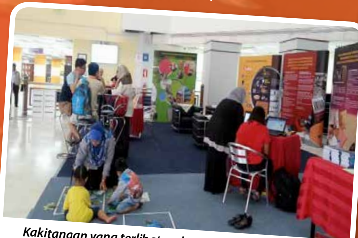
Kakitangan yang terlibat melayan pertanyaan pengguna perpustakaan

Terdapat pelbagai aktiviti yang disediakan sepanjang program ini berlangsung. Antaranya pameran mengenai perkhidmatan yang disediakan di PNM, pendaftaran keahlian PNM, u-Pustaka dan PNM Digital, jualan buku terbitan PNM, aktiviti santai jawi, sesi Literasi Maklumat & Media Pengguna dan aktiviti kanak-kanak.