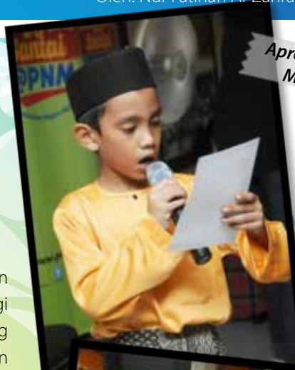
Apresiasi Puisi Merdeka

Aktiviti ini diadakan sempena sambutan bulan kemerdekaan ke-58 dan sambutan Hari Malaysia. Objektif aktiviti adalah bagi menerapkan nilai-nilai patriotisme di kalangan pengunjung perpustakaan. Di samping itu, aktiviti ini juga bertujuan mempromosikan perkhidmatan dan koleksi bahan bacaan yang terdapat di perpustakaan dalam usaha memperkasakan budaya membaca di kalangan masyarakat.