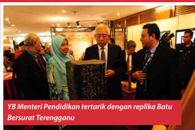
YB Menteri Pendidikan tertarik dengan replika Batu Bersurat Terengganu