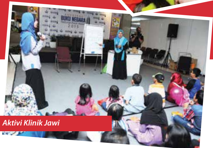
Aktivi Klinik Jawi