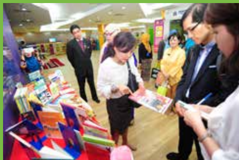
Perpustakaan Kanak-kanak PNM