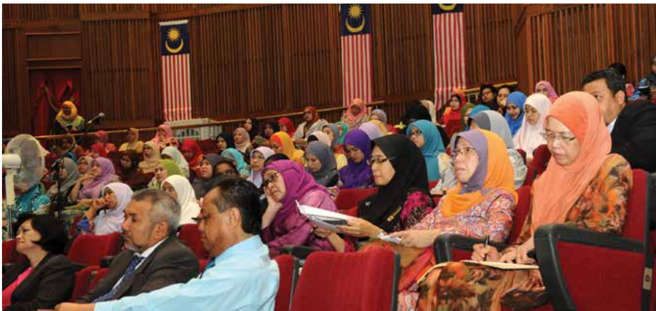
Barisan pengurusan dan kakitangan PNM yang hadir memberikan tumpuan mengenai perubahan dalam pelaksanaan ISO 9001: 2015