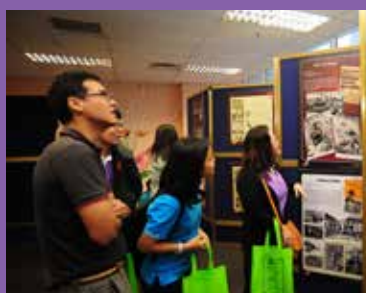
Pusat Rujukan Malaysiana (Pameran Koleksi Nadir)