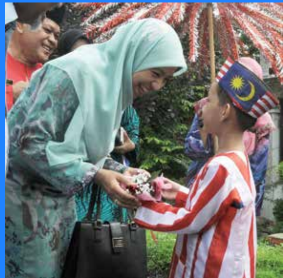
KP PNM disambut oleh si cilik

Pelbagai aktiviti menarik telah disusun sempena Majlis Perasmian Program Bahasa Merentas Desa antaranya pertandingan warna dalam bahasa, bercerita, baca jawi, pertandingan busana tradisional sambil berpantun, deklamasi sajak, menjahit butang baju, dan menulis khat. Aktiviti ini diadakan mengikut kategori dan peringkat umur, bermula daripada tadika sehingga kaum ibu dan bapa.