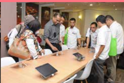
Samsung Smart Library (SSL) Zon Membaca