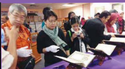
Pusat Kebangsaan Manuskrip Melayu