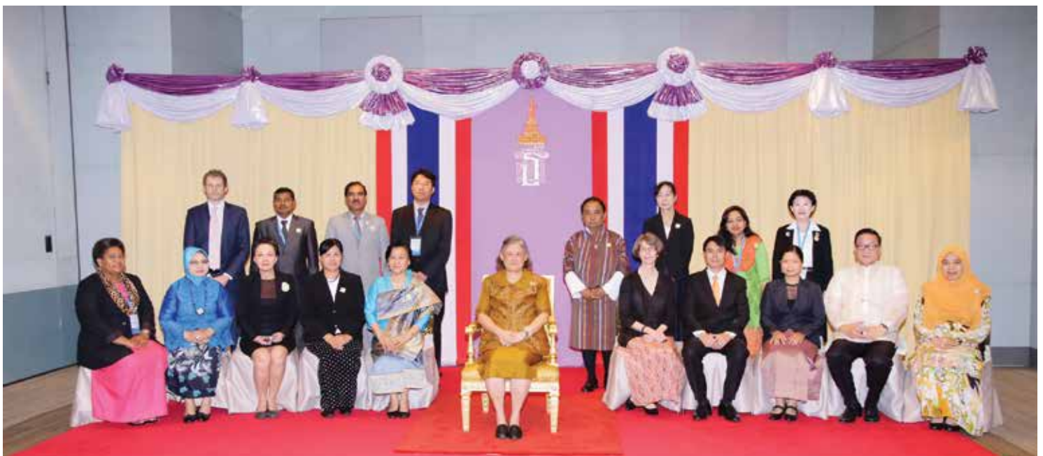
Delegasi dari IFLA dan negara-negara ASEAN berfoto bersama HRH Princess Maha Chakri Sirindhorn

Acara penutup Persidangan CONSAL XVI telah diadakan pada lewat petang, 12 Jun 2015 di Grand Hall, BITEC. Antara pengisian menarik semasa majlis penutup Persidangan CONSAL XVI ini adalah Majlis Penyampaian Anugerah Pustakawan Cemerlang ASEAN, persembahan kebudayaan oleh para Pustakawan Thai, majlis penyerahan bendera kepada wakil Myanmar selaku hos Persidangan CONSAL yang akan datang dengan diakhiri oleh persembahan kebudayaan oleh negara Myanmar. Majlis makan malam telah diadakan pada sebelah malam dan telah ditaja oleh pembekal perkhidmatan pangkalan data perpustakaan iaitu Access Dunia.