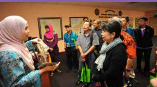
Taklimat Koleksi Nadir dan Peribadi