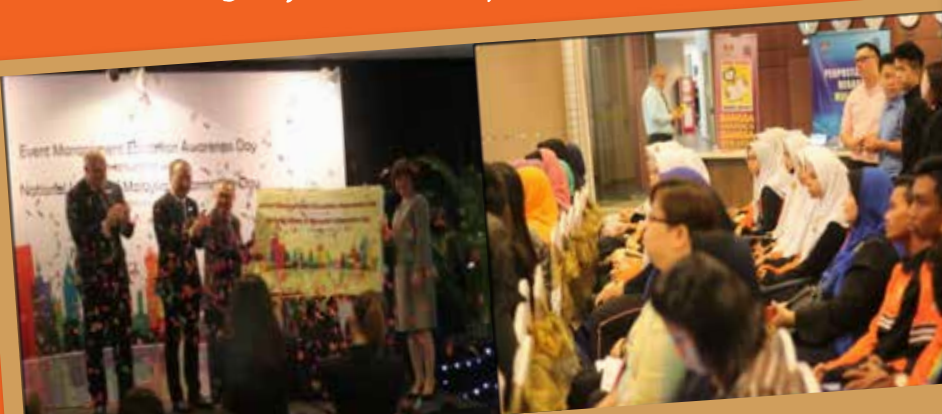
Majlis Perasmian dengan gimik pelancaran simbolik satu kerjasama antara Perpustakaan Negara Malaysia dengan Berjaya Universiti Kolej.

Berjaya University College of Hospitality