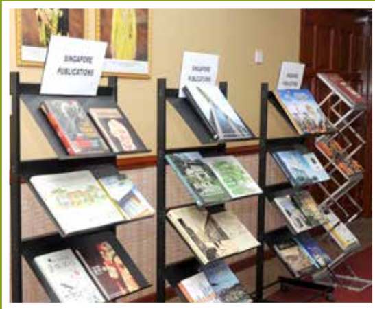
Antara buku-buku sumbangan Kedutaan Singapura

Buku-buku tersebut merangkumi pelbagai tajuk berkaitan seni bina, biodiversiti, pembangunan, ekonomi, sejarah dan kesusasteraan Singapura telah diserahkan kepada Ketua Pengarah PNM oleh Pesuruhjaya Tinggi Singapura di Malaysia