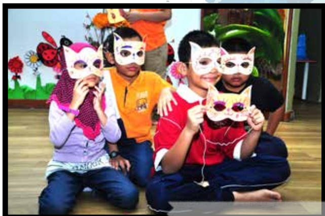
Kraftangan Topeng Kucing