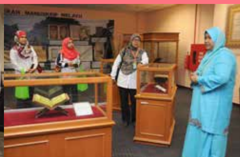
Pusat Kebangsaan Manuskrip Melayu