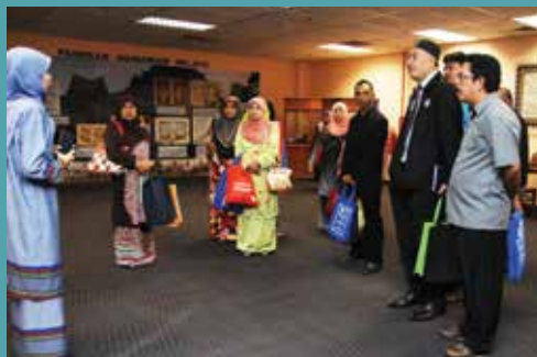
Pusat Kebangsaan Manuskrip Melayu