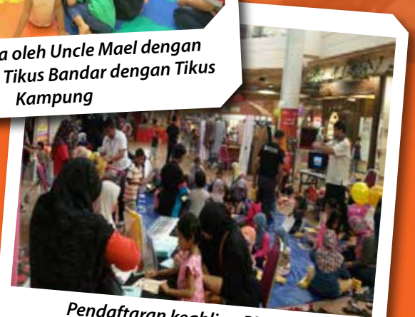
Pendaftaran keahlian PNM dan U-Pustaka di hadapan Watson

Berjaya University College of Hospitality