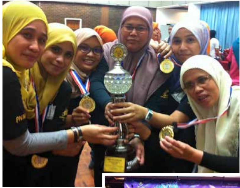
Piala Pusingan Kejuhan Badminton Antara Agensi 2015 milik PNM