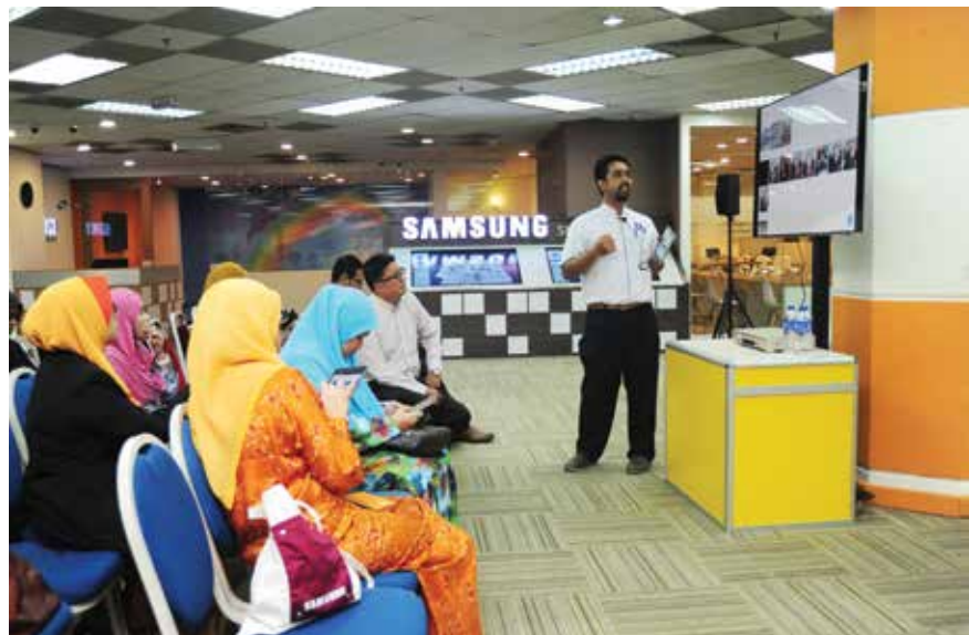
Para guru sekolah sedang mengikuti taklimat dan sedang menguna gajet Samsung di PNM

Melalui pendedahan ini dapat memberi kemahiran kepada peserta mengenai penggunaan gajet yang boleh memberi kesan positif kepada pembelajaran golongan kanak-kanak mahupun golongan dewasa.