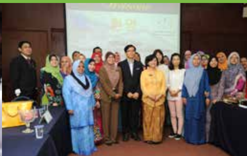
Delegasi bergambar kenangan