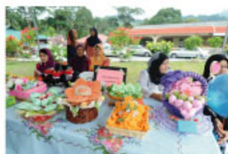
Peserta-peserta tidak sabar menunggu keputusan

Pertandingan ini juga terbuka kepada semua penduduk yang berhampiran. Seramai 8 orang telah menyertai pertandingan ini.