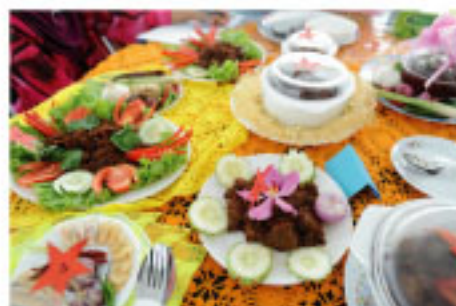
Salah satu gambaran mengenai masakan rendang yang telah dipertandingkan

Pertandingan ini terbuka kepada semua penduduk Kampung Gagu dan juga penduduk sekitar yang berhampiran. Seramai 11 orang peserta telah menyerta pertandingan ini.