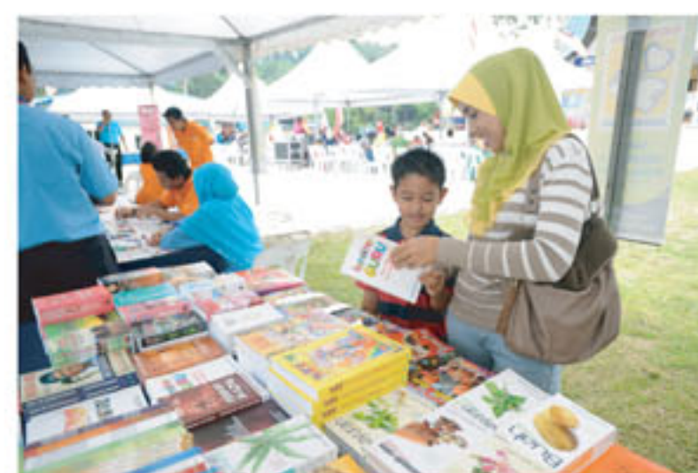
Salah seorang pengunjung asyik membelek buku

Kerajaan. Dengan kelengkapan bahan bacaan yang sesuai untuk pelbagai peringkat umur disuntik pula dengan kemudahan kemudahan internet kepada penduduk setempat akan menjadikan perpustakaan ini sebagai tempat tumpuan kepada masyarakat setempat.