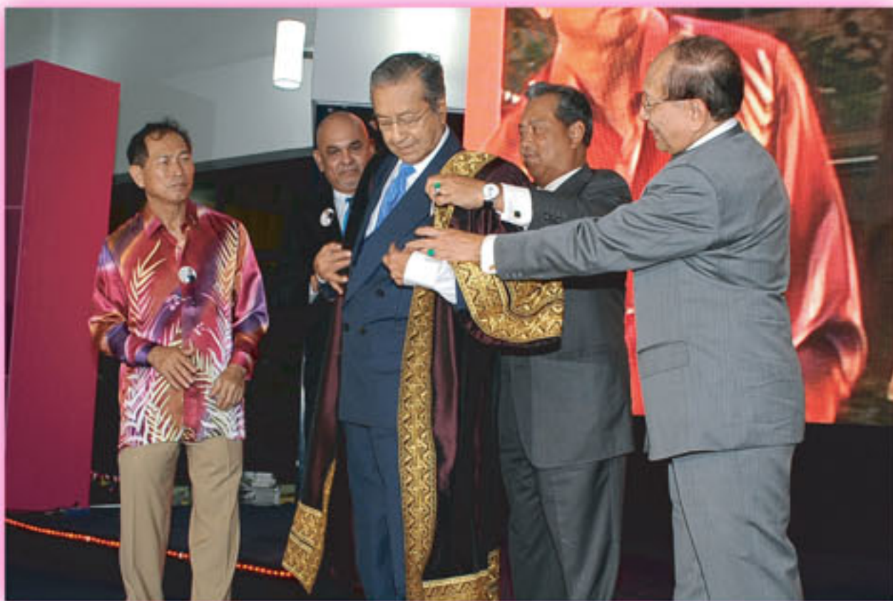
Majlis penyampaian jubah keramat, ikon Membaca 1Malaysia oleh YAB Timbalan Perdana Menteri dan YB Menteri KPKK kepada Mantan Perdana Menteri Malaysia keempat Tun Dr Mahathir Mohamad