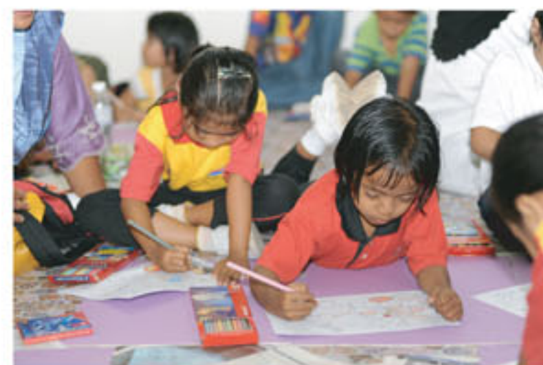
Menirap juga boleh mendapatkan mod

Pertandingan terbuka kepada semua kanak-kanak tahap 1 yang menghadiri Karnival Membaca 1Malaysia Perpustakaan Desa Kampung Gagu. Seramai 51 orang kanak-kanak telah menyertai pertandingan ini yang merupakan kanak-kanak dari tadika yang berhampiran iaitu Tadika Triang.