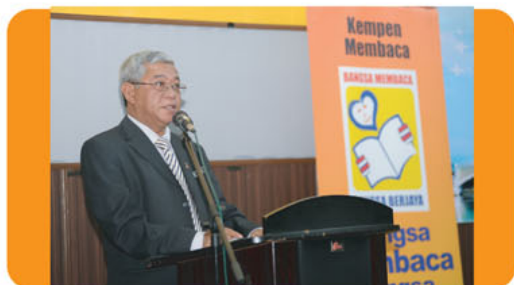
YBhg dato' Ketua Pengarah PNM semasa ucapan beliau di KISDAR, Kuala Kangsar, Perak

PROGRAM MARI MEMBACA 1MALAYSIA: BACA@ SAYONG SEMPENA HARI BUKU DAN HAK CIPTA SEDUNIA 2012