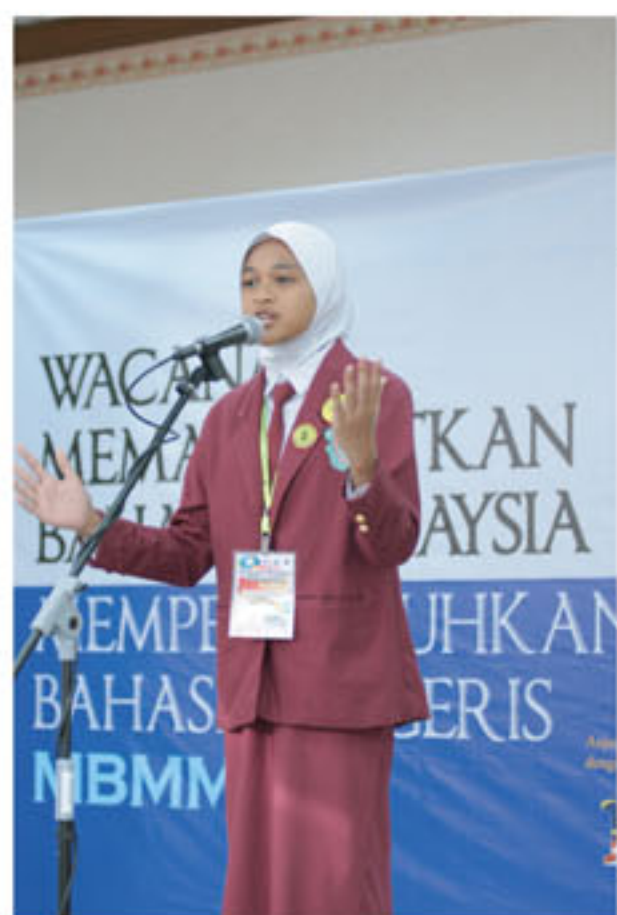
Peserta yang menyertai Public Speaking Competition juga tidak kurang hebatnya

Public Speaking Competition dengan 6 penyertaan tertinggi yang bertanding di peringkat akhir melibatkan 24 penyertaan dari 28 buah sekolah.