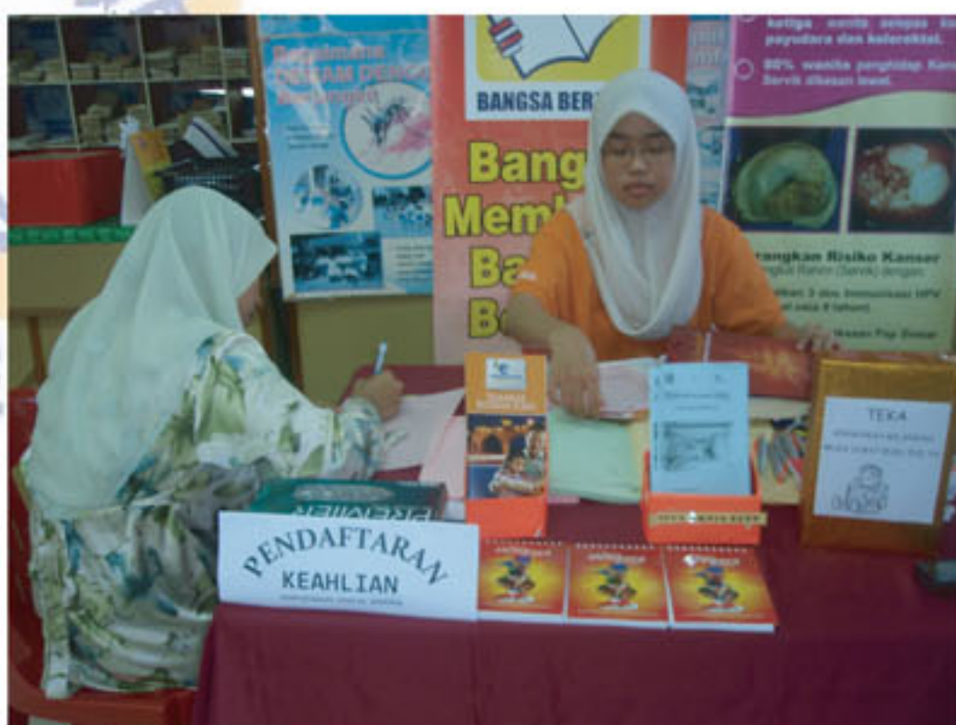
Di Booth PNM juga terdapat pelbagai brosur-brosur bagi mempromosi perkhidmatan yang disediakan oleh PNM