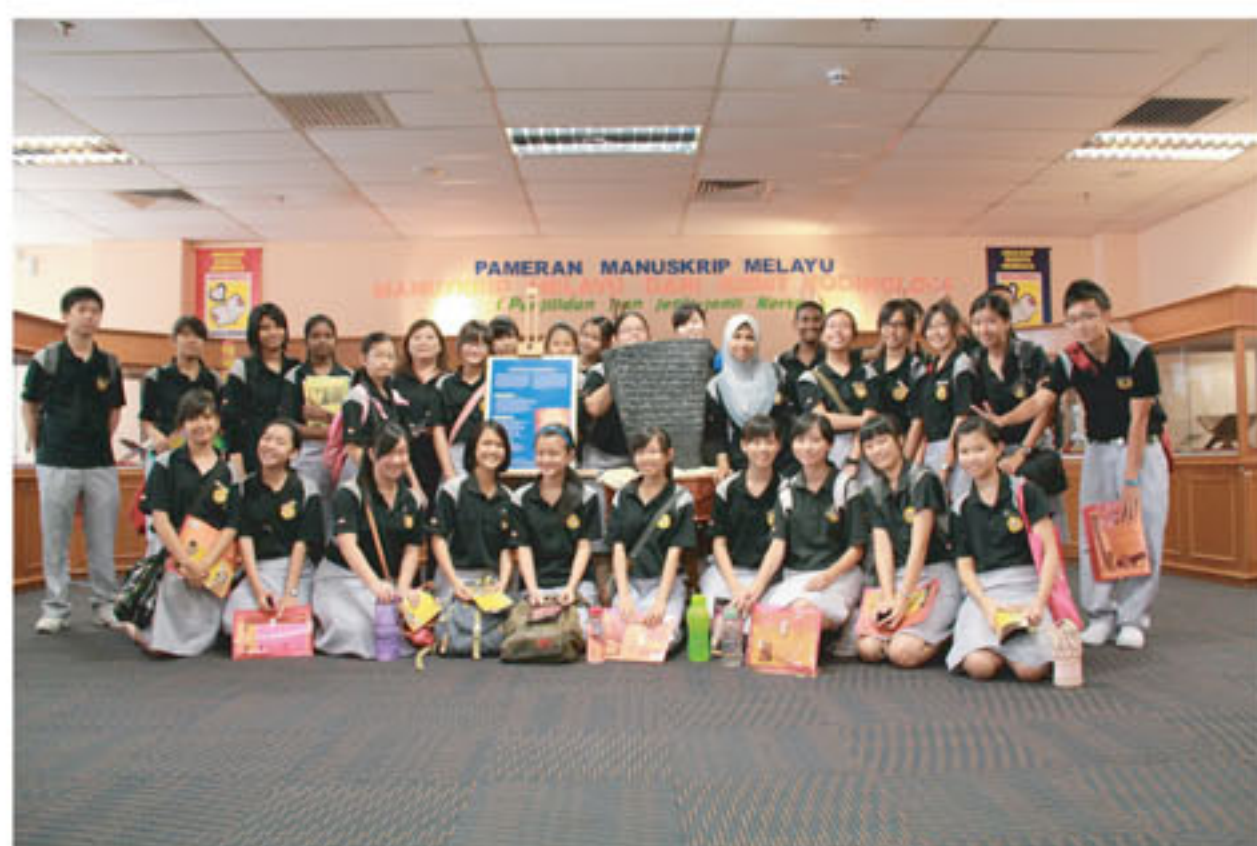
Peserta lawatan ke PNM yang selesai semasa sesi pengguna PNM bergambar kenangan