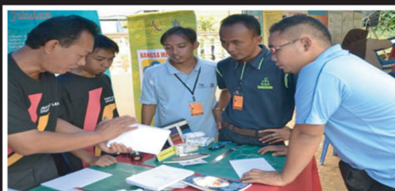
Bahagian Pemeliharaan, Perpustakaan Negara Malaysia tidak ketinggalan dalam menyertai aktiviti Kembara Jalur Lebar dan Galakan Membaca 1Malaysia