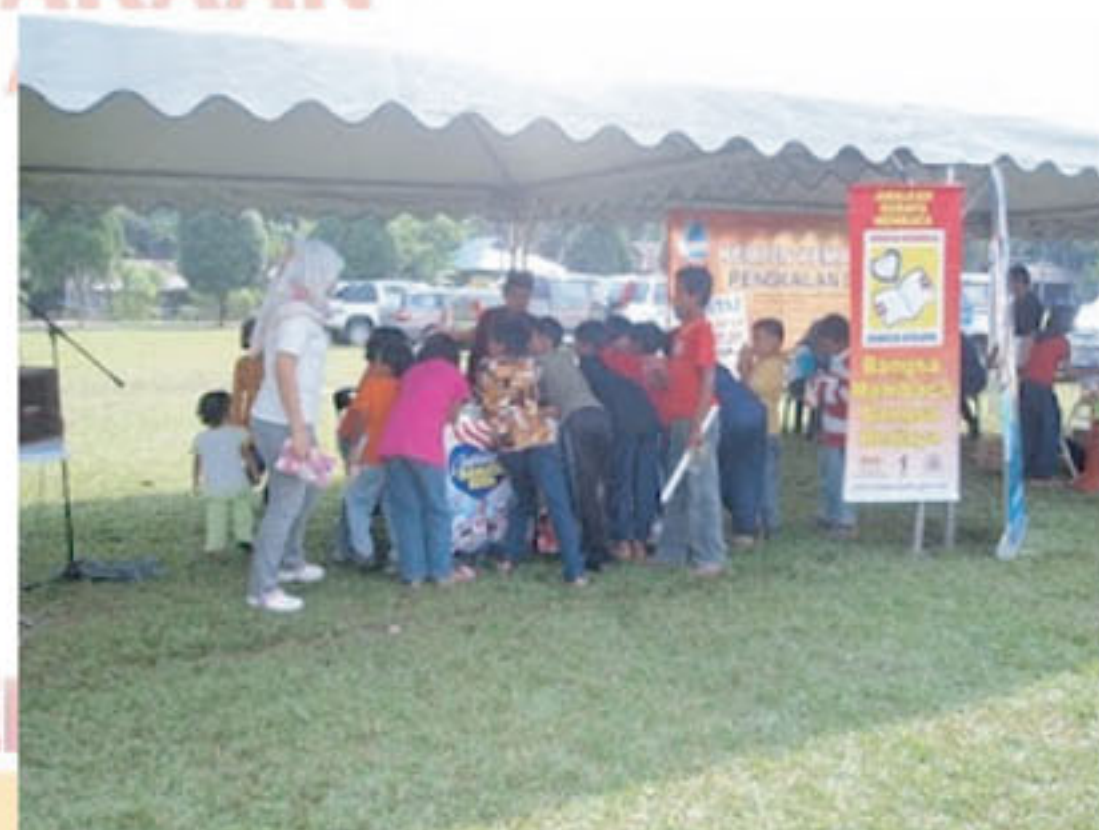
Antara senario kanak-kanak yang menyertai aktiviti yang disediakan oleh penganjur