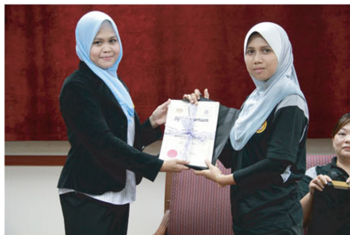
Salah satu Guru pengiring pelajar-pelajar semasa lawatan ke PNM menerima menyampaikan cenderahati kepada salah seorang pegawai PNM