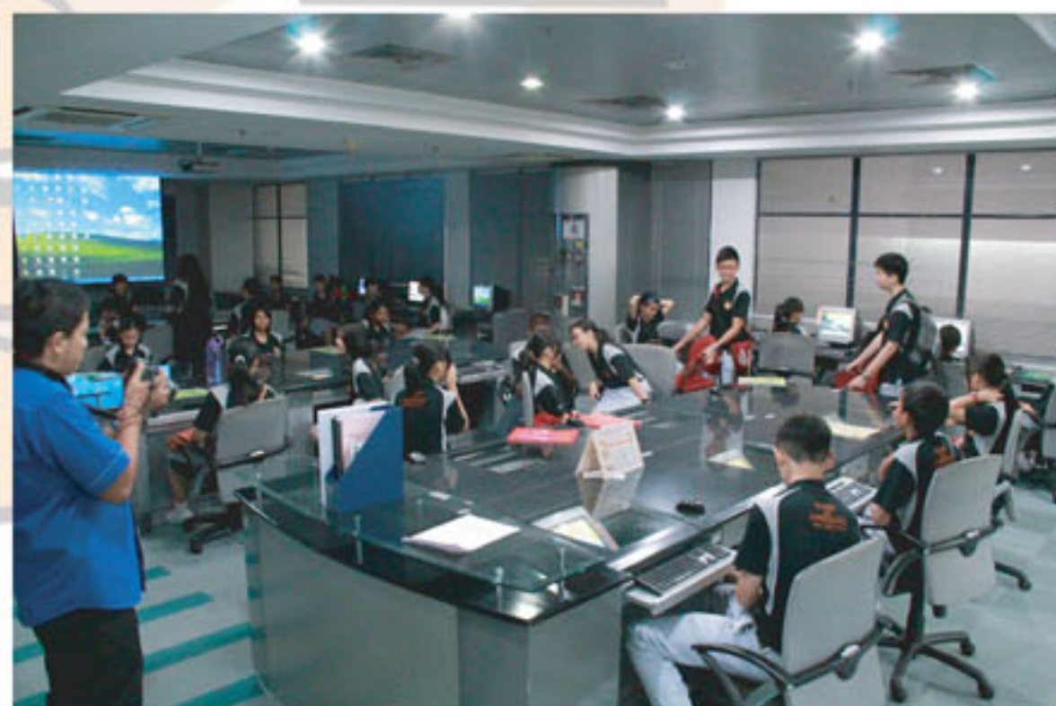
Salah satu gambaran suasana di Pusat Hipermedia Dewasa, PNM semasa lawatan dan sesi pendidikan pengguna PNM