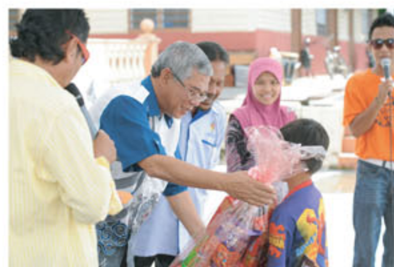
Dato' Ketua Pengarah menyampaikan hadiah bagi cabutan bertuah

Kesimpulannya, Karnival Membaca 1Malaysia Kampung Gagu merupakan satu medium yang baik dalam usaha mempromosikan Perpustakaan Desa Kampung Gagu sebagai salah satu pusat komuniti. Ia mampu memberi impak yang positif untuk menarik lebih ramai pengunjung ke perpustakaan berkenaan seterusnya menggunakan kemudahan yang disediakan oleh