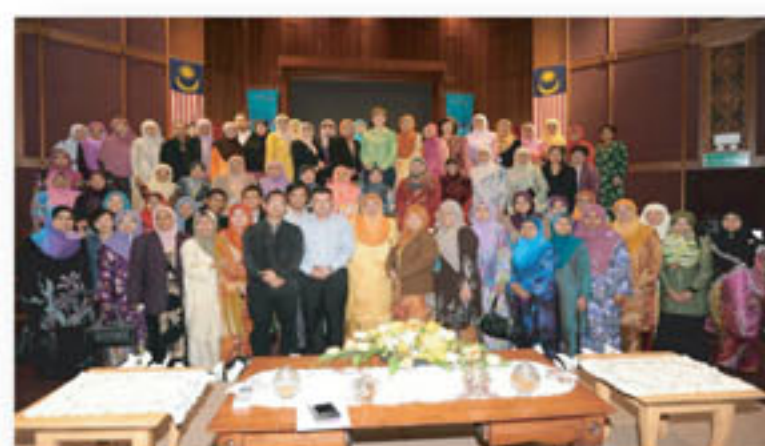
Gambar kenang-kenangan peserta-peserta seminar

Berdasarkan perubahan besar ini dalam dunia sumber maklumat, Perpustakaan Negara Malaysia telah menganjurkan satu Seminar Resource Description and Access (RDA) dengan tema RDA : The future standards of bibliographic control pada 27-29 Mac 2012 bertempat di Auditorium Perpustakaan Negara Malaysia. Seminar ini telah di rasmikan oleh Yang Berbahagia Dato' Raslin Abu Bakar, Ketua Pengarah Perpustakaan Negara Malaysia dengan kehadiran terdiri dari Pustakawan, Pengurus Pusat Sumber, Pegawai Sistem Maklumat, pensyarah-pensyarah dari organisasi swasta, badan berkanun dan agensi