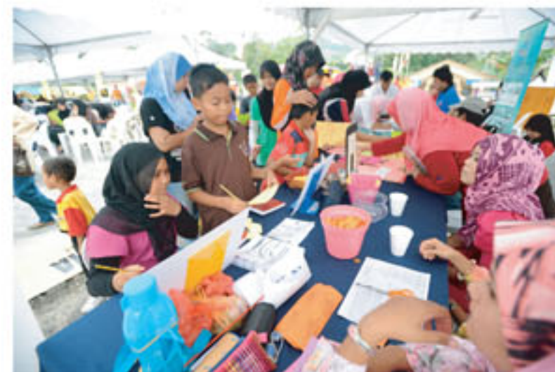
Antara suasana semasa acara pendaftaran berlangsung

Pertandingan ini memerlukan pengunjung untuk meneka jumlah halaman buku yang dipamerkan di ruang aktiviti PNM .