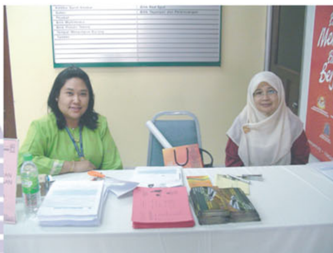
Kakitangan Perpustakaan Negara Malaysia giat menjalankan kempen keahlian perpustakaan di seluruh negara