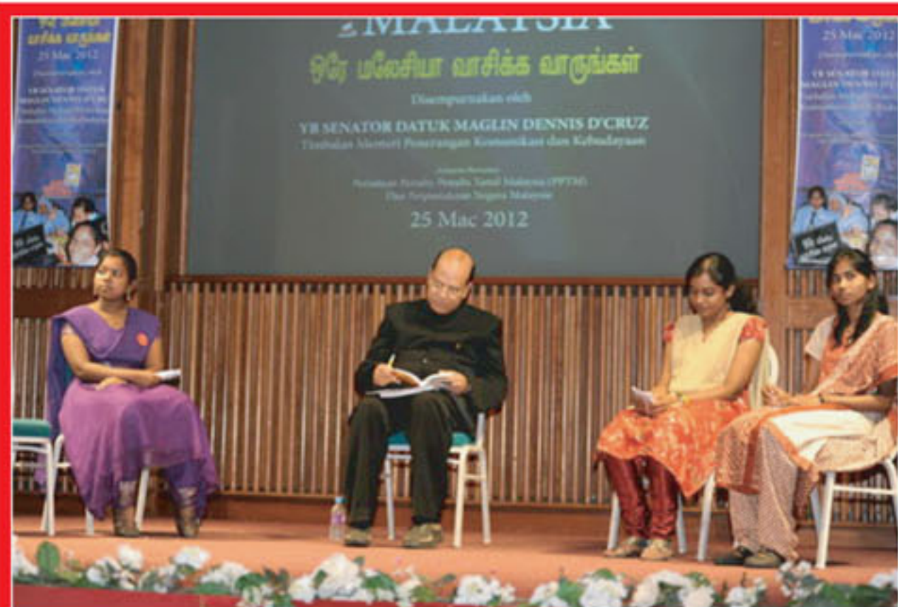
Pertandingan ulasan novel telah diadakan dengan melibatkan pelajar-pelajar universiti

• Pameran dan Jualan Buku Pameran dan jualan buku pelbagai genre telah diadakan oleh pembekal-pembekal buku dan penulis-penulis Tamil sendiri.