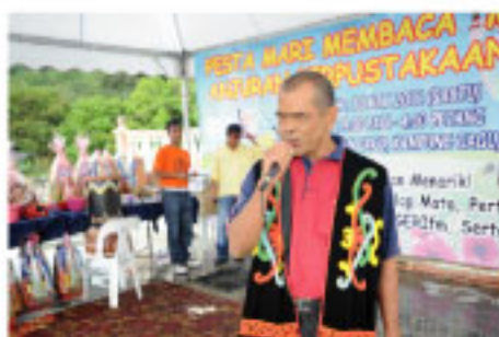
Salah seorang peserta beraksi di pentas

Pertandingan Karaoke yang terbuka kepada golongan veteran telah disertai oleh 6 orang peserta.