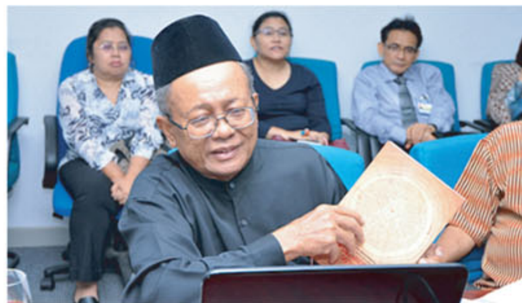
Dr Harun mat Piah sedang asyik membelik helaian asalmanuskrip melayu lama sambil diperhatikan oleh peserta-peserta

Manuskrip Melayu dalam bentuk digital itu adalah usaha menarik minat golongan muda yang kini lebih gemar menggunakan sistem komunikasi yang canggih seperti telefon bimbit blackberry, iphone, computer dan sebagainya untuk mendapatkan maklumat dengan cara yang mudah dan pantas. Sebanyak 2,000 naskhah Manuskrip Melayu (PNM) yang ditulis dalam jawi klasik berusia ratusan tahun ke dalam bentuk digital agar ia boleh diakses lebih mudah dan pantas.