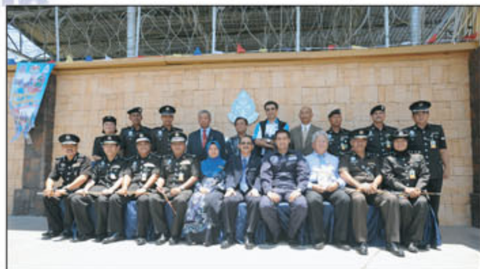
Bergambar kenangan sebelum pulang

Kemudahan perpustakaan yang disediakan telah membantu pelajar mengulangkaji pelajaran sekaligus menyumbang kepada peningkatan pencapaian akademik pelajar di penjara. Keputusan SPM bagi tahun 2011 mencatatkan daripada seramai 108 orang yang menduduki peperiksaan, 100 orang telah lulus dengan peratusan 91.67%. Gred purata sekolah ialah 4.47%, lebih baik daripada purata kebangsaan iaitu 5.04%. Pada tahun ini 13 mata pelajaran telah mencatat kelulusan melebihi 80%. Antara pencapaian cemerlang pada tahun ini seorang pelajar telah mendapat 9A, 3 orang mendapat 6A dan 2 orang telah mendapat keputusan 5A. Seorang pelajar Sekolah Integriti Kajang telah menjadi salah seorang pelajar terbaik SPM peringkat negeri Selangor.