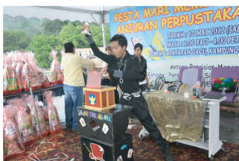
Badut dengan acara silap matanya di pentas

Persembahan silap mata dan badut diadakan bertujuan untuk menarik pengunjung ke program tersebut.