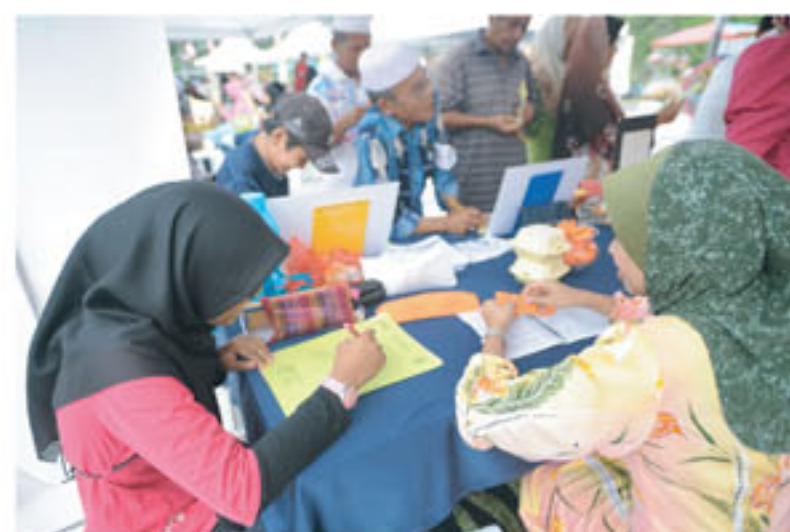
Peserta sedang menyertai pertandingan mewarna yang dijalankan

Aktiviti berbentuk permainan secara santai seperti permainan pembelajaran, Gali Kata, Bina Kata, Pantas Jawi, dan Silang Kata Jawi diadakan bagi menarik minat kanak-kanak.