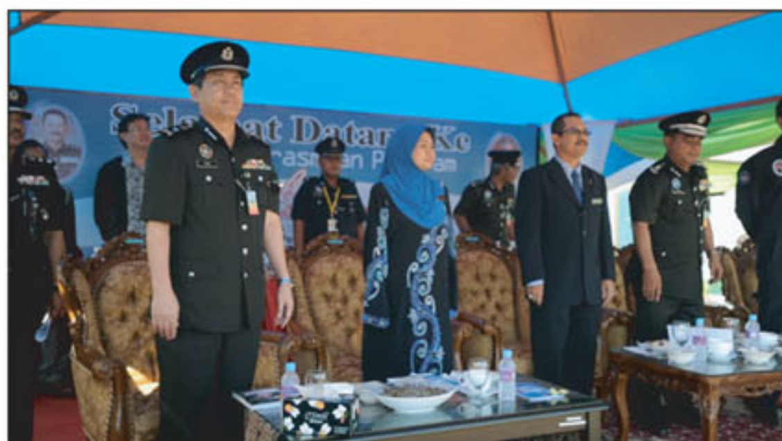
Tetamu-terhormat berdiri menyanyikan lagu kebangsaan dan lagu mari membaca

Antara pengisian aktiviti bengkel literasi maklumat dan Mari Membaca Bersama. Selain itu, program ini turut diserikan dengan kehadiran Angkasawan Negara, Dato' Sheikh Muszaphar Shukor Al-Masrie yang menyampaikan ceramah motivasi kepada penghuni institusi penjara dan pelajar sekolah berdekatan. PNM turut menyampaikan sumbangan bahan bacaan untuk perpustakaan.