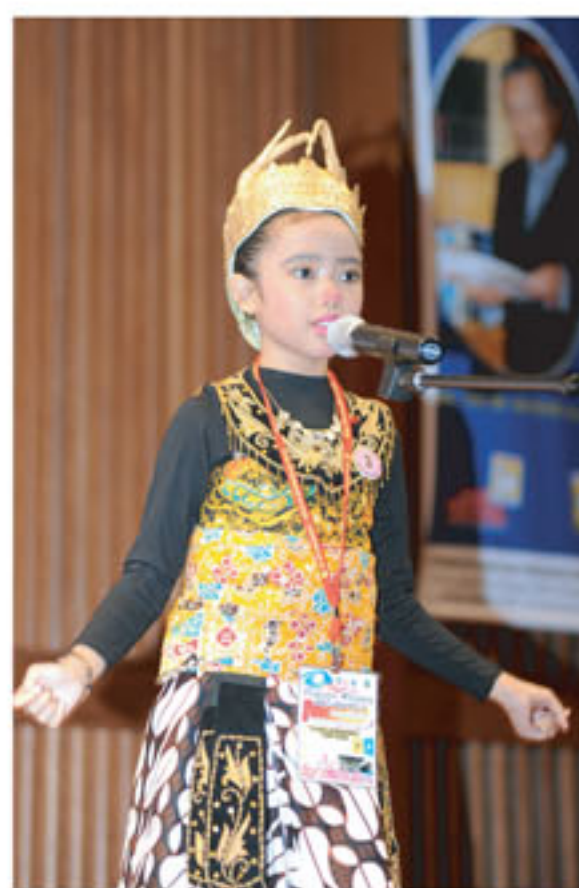
Aksi salah seorang peserta dalam pertandingan International Open Story Telling Competition

Pertandingan ini merupakan pertandingan dengan penyertaan dari sekolah-sekolah di peringkat antarabangsa yang melibatkan negara-negara Asia Tenggara seperti Indonesia, Brunei dan Singapura yang melibatkan 30 penyertaan. Pertandingan ini juga telah diadakan pada 19 Mei 2012 di peringkat saringan. Sebanyak 6 penyertaan tertinggi telah bertanding di peringkat akhir pada 20 Mei 2012.