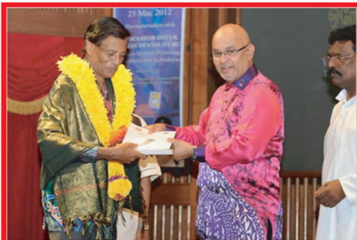
YB Senator Datuk Timbalan Menteri PKK menyampaikan anugerah kepada salah seorang penulis

• Ucapan Tokoh Sasterawan PPTM telah menjemput tokoh sasterawan ulung Tamil iaitu YBhg Dato' Theiveegan, Timbalan Ketua Polis Negeri Selangor menyampaikan ucapan bagi memberi galakan dan dorongan kepada generasi muda untuk menghasilkan karya-karya penulisan yang bermutu.