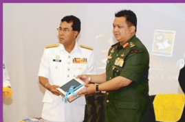
DYTM Raja Muda Perlis menyerahkan iPad kepada Panglima Wilayah Laut 2