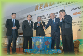
Timbalan Menteri KPKK, YB Senator Datuk Maglin Dennis D'Cruz merasmikan Read Malaysia 2011 di Pentas Utama

ReadMalaysia'11 memaparkan visual sebenar dimana tahap budaya membaca masyarakat Malaysia. Dengan kehadiran masyarakat yang tidak putus-putus boleh disimpulkan memang masyarakat kita telah mengamalkan amalan membaca selain menjadikan buku sebagai keperluan. Kerana itu, berduyung-duyung masyarakat mengambil peluang untuk mencari koleksi bahan bacaan yang diingini.