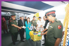
Delegasi OP PASIR Perlis menyumbangkan bahan bacaan di kapal KD KEDAH.