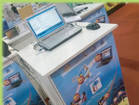
Perkhidmatan U-Pustaka yang disediakan oleh Perpustakaan Negara Malaysia

Senarainya program ilmu sebegini naras diteruskan dan perlu difahami, tanggungjawab melahirkan bangsa bermaklumat bukanlah terletak pada bahu Kerajaan semata-mata, malah individu dan syarikat-syarikat swasta turut bertanggungjawab bersama-sama kerajaan berkempen untuk melahirkan masyarakat yang bermaklumat menerusi memperkasakan budaya membaca. Inilah yang dibuktikan oleh MINES Event Sdn. Bhd dengan memainkan peranan penting dalam menjayakan aspirasi Kerajaan melahirkan masyarakat berbudaya maju dengan penerapan amalan membaca secara berterusan. Tahniah diucapkan kepada seluruh warga MINES Event Sdn. Bhd.