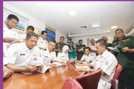
Anggota TLDM membaca daripada bahan bacaan yang disediakan di sudut bacaan kapal KD KEDAH.

Pada 13 Ogos yang lalu, Perpustakaan Negara Malaysia (PNM) meneruskan jelajah Kempen Membacanya melalui siri Mari Membaca 1Malaysia. Kali ini, siri Kempen Membaca tersebut disasarkan kepada kumpulan tentera laut, kerana itu program Mari Membaca 1Malaysia tersebut dinamakan sebagai Seluas Lautan Ilmu Ditimba.