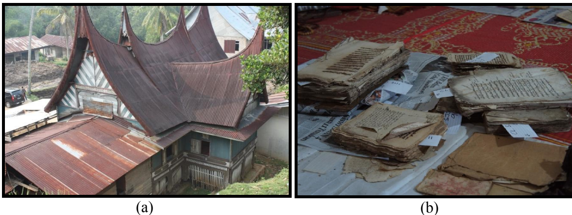
Gambar 1. (a) Bangunan Surau Calau tampak dari atas; (b) Sebahagian naskhah koleksi Surau Calau

Sebahagian besar naskhah tersebut merupakan koleksi surau-surau tarekat yang tersebar di berbagai tempat di Sumatera Barat (salah satunya lihat pada Gambar 1). Konsep surau dalam kebudayaan Minangkabau berbeza dengan masjid. Surau secara sosial-budaya Minangkabau memiliki fungsi melampaui masjid. Surau merupakan institusi tempatan yang digunakan tidak hanya urusan keagamaan, tetapi juga segala sesuatu yang berhubung kait dengan urusan sosial dan budaya. Surau merupakan lembaga peribumi yang menjadi pusat pengajaran Islam dan menjadi titik tolak penyebaran Islam di Minangkabau (Azyumardi Azra, 2003: 7-16).