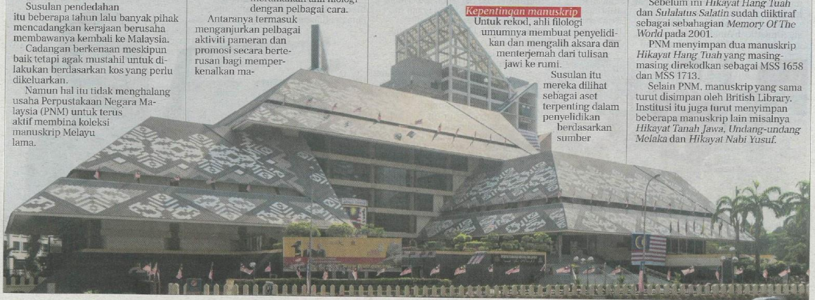
Salasiah Abdul Wahab

“Sehingga kini PNM mempunyai 5,205 manuskrip asal dalam koleksinya dan 2,719 lagi sudah pun didigitalkan”